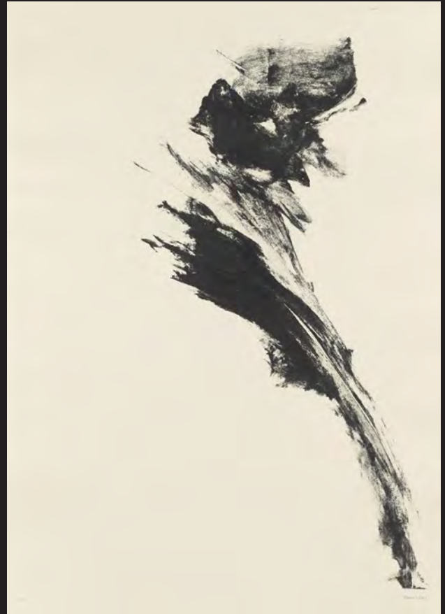
Grønn 2013 Colagraf/Collagraph 99 x 69 cm