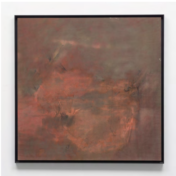
Menéndez Hevia 2012 Técnica Mixta sobre papel/Mixed technique on paper 121 x 121 cm