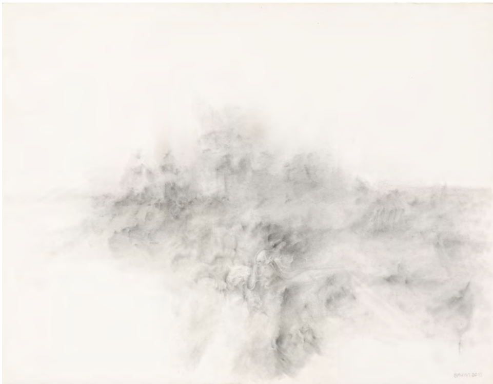
Grønn 2011 Grafito sobre papel/ Graphite on paper 50 x 65 cm