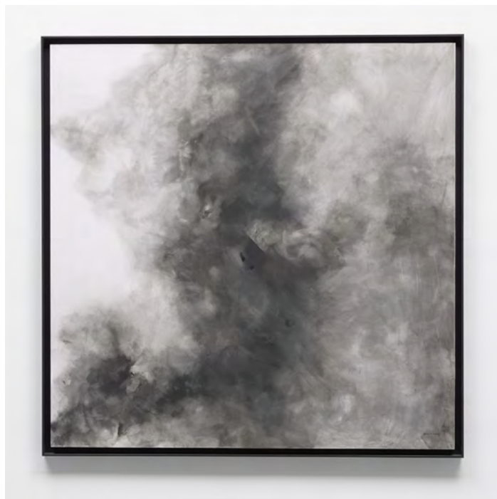
Grønn 2008 Tinta sobre papel/Ink on paper 121 x 121 cm