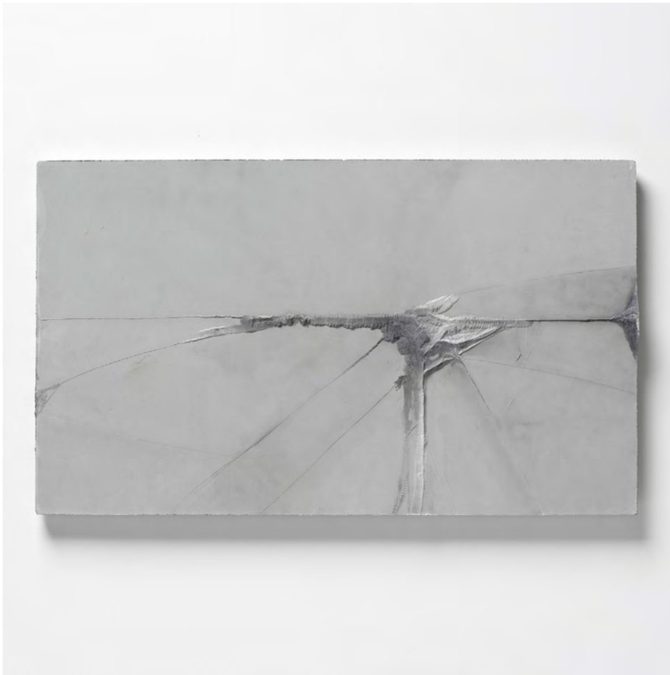
Menéndez Hevia 2014 Hormigon/Concrete 60 x 102 cm