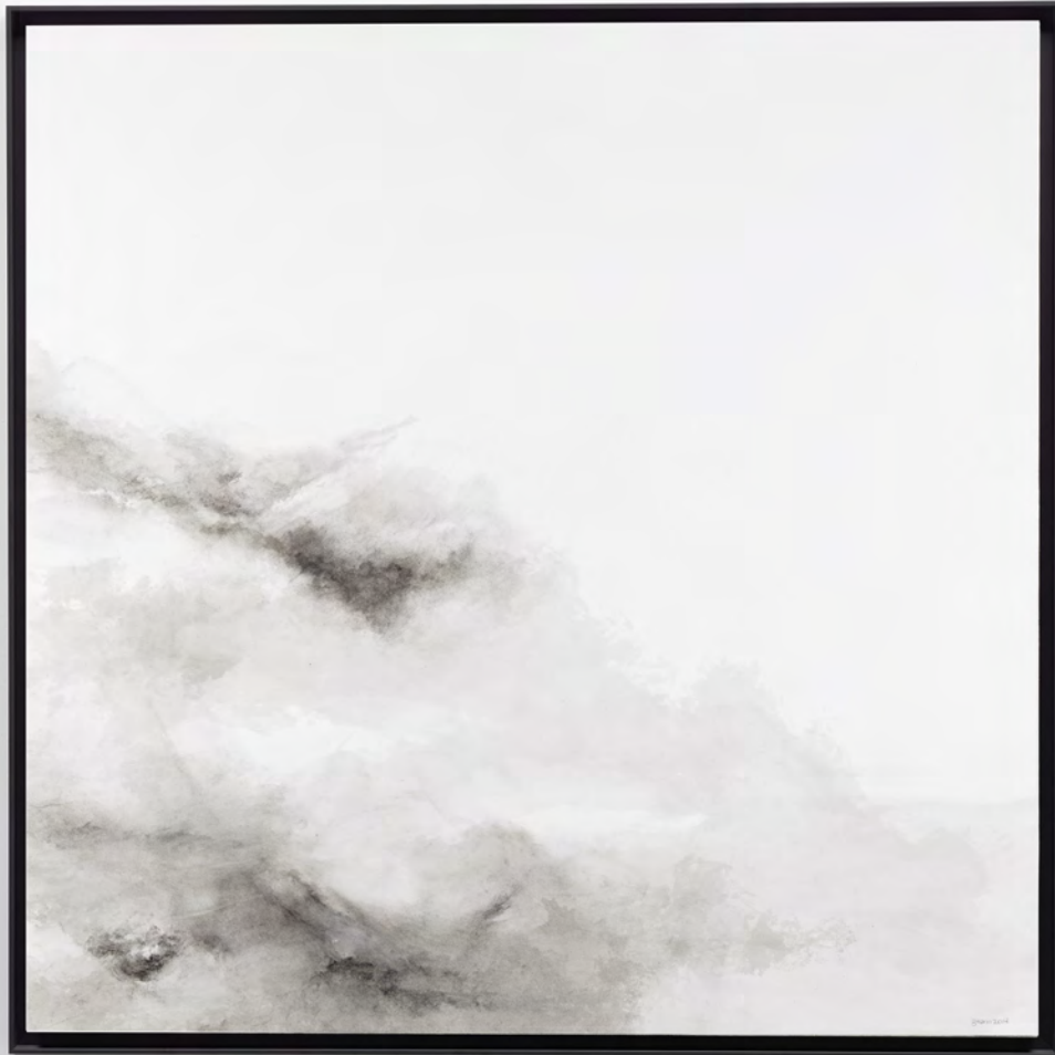
Grønn 2014 Tintas sobre papel/Ink on paper 121 x 121 cm