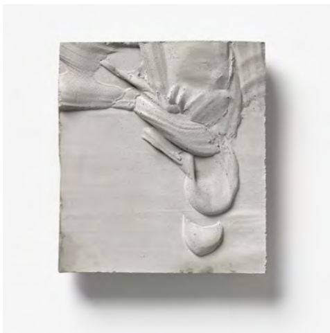
Grønn 2014 Hormigon/Concrete 27 x 24,5