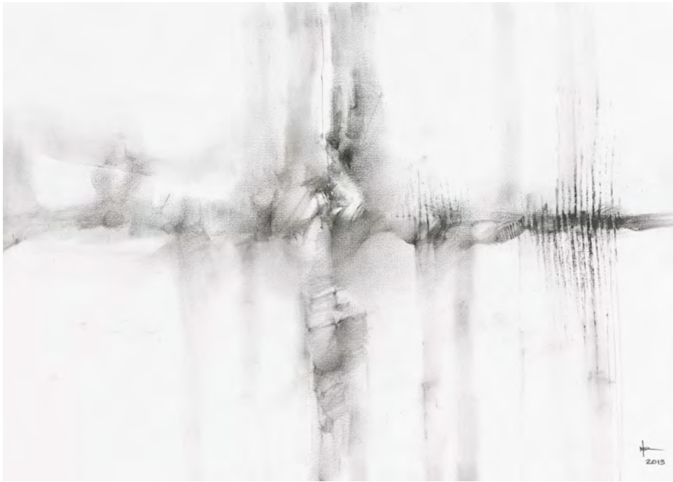
Menéndez Hevia 2013 Carboncillo sobre papel/ Charcoal on paper 29 x 43 cm