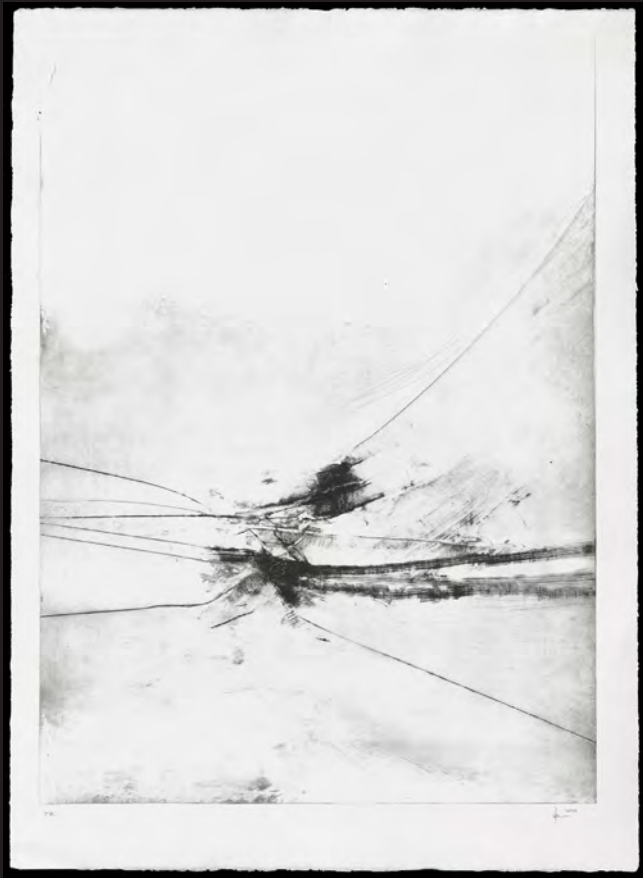
Menéndez Hevia 2013 Punta seca/Drypoint 69 x 50 cm